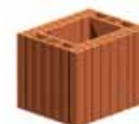
Komínová tvarovka HM - MINI