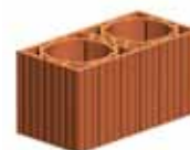
Ventilační tvarovka H2 - dvojitá