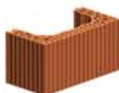
Broušená komínová tvarovka HU