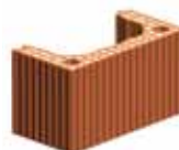
Broušená komínová tvarovka vyplněná perlitem