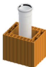
HELUZ MINI - PLAST