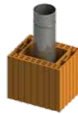
HELUZ MINI - METAL