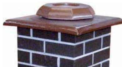
Keramická krycí deska hnědá