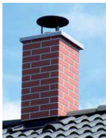
Obklad cihelnými pásky HELUZ