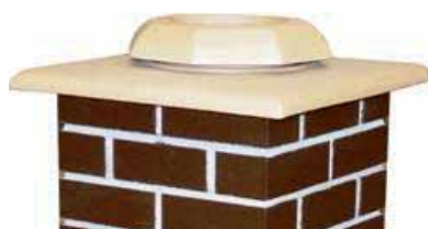
Keramická krycí deska písková