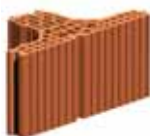
Broušená komínová tvarovka HT