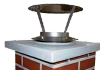
Nerezový límec se stříškou