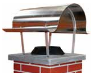
Komínové stříšky Napoleon z mědi a z nerez, litinové límce, sklovláknobe- tonová krycí deska