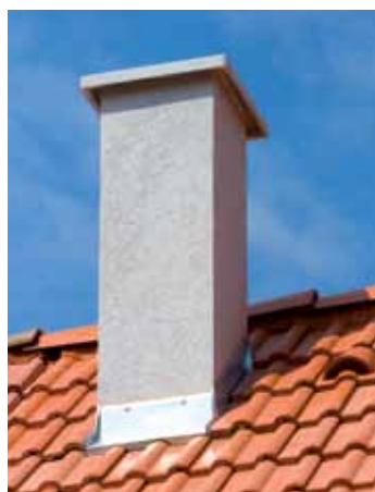
Omítnutý komín kvalitní a levné řešení